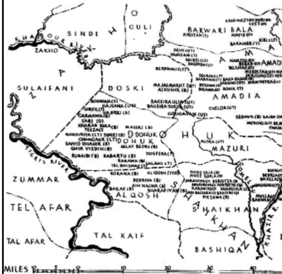
ASSYRIANS WERE SETTLED 1920-1933. (Purely Kurdish Villages are not shown)