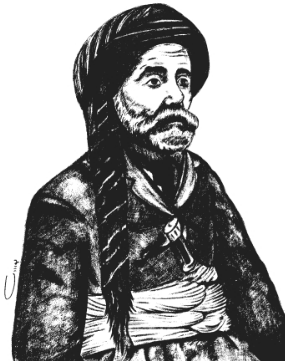
ھاجى نۇنىقى پىرەھىيە