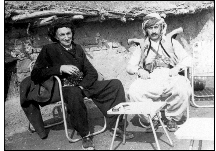
هیدی له خزمهت شیخ عوبه یدوللای نهخش بهندی دا له گوندی زینوی