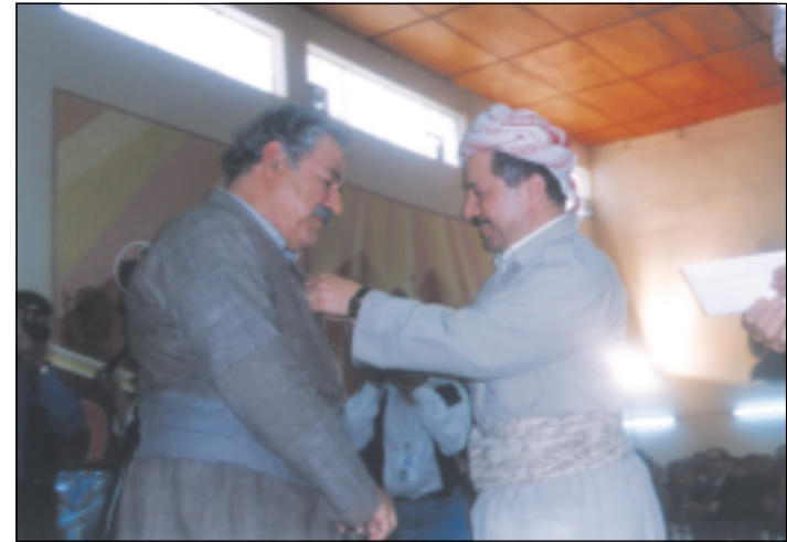
وه‌رگرتنی خه‌لاتی بارزانی سالی ۱۹۹۳ هه‌ولتیر سەرۆک بارزانی مه‌دالیای بارزانی نهمر به فه‌له‌که‌دین کاکه‌یی ده‌به‌خشی