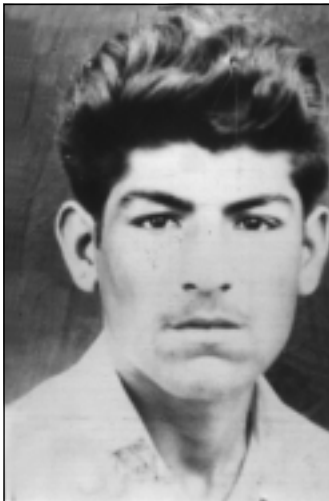
فهله که دین کاکه یی له هه رته ی لاویدا - ۱۹۶۰ ناماده یی که رکوک