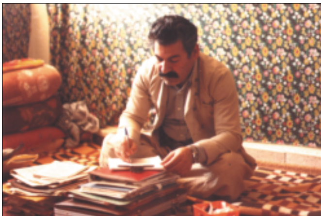
له مەكتەبی ناوه‌ندی راگەیاندن له مەكتەبی سیاسی، راژان هاوینی ۱۹۸۰