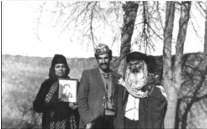
له راسته وه بۆ چهپ: باوکی فهله که دین ، برای فهله که دین، دایکی فهله که دین ... که وینه یه کی فهله که دین - ی بۆ یادگاری هه لگرتوو ده، سالی ۱۹۸۳.