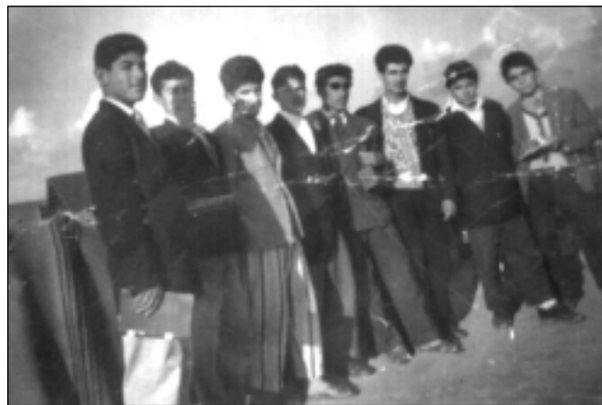
۱۹۵۹ که رکوک