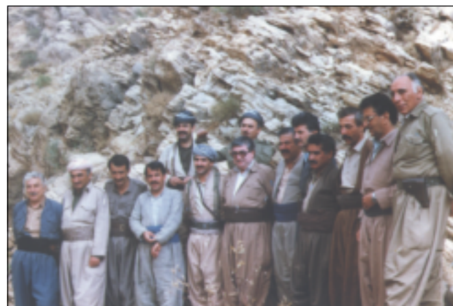
له کۆبوونه وه ی بهر هی کوردستانی گوێزی، پایزی ۱۹۸۷