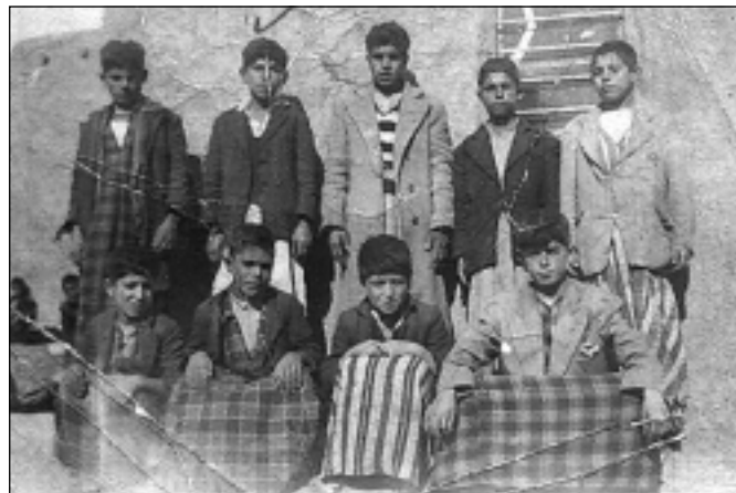
فه له که دین کاکه یی، دووهم کهس له چه په وه وه ستاوه سالی ۱۹۵۵ قوتابخانه ی توپزان-داقوق-که رکوک

- ویژدانی خۆم ته گه ر بتوانم هه میشه مافی (ویژدان) م له خۆم (واته: له هه بوونی فیزیکم). خۆشتر بویت، مانای نه وه یه که مندالانم و که سوکارو دۆست و براده رانی راستگۆ خه لکی دلپاکی نیشتمانه که م، له خۆم زیاتر خۆش و بیستووه، هه رکاتیک (ویژدان) بالاده ست بیت، ئینسان ده بیته به خشیارو خۆبه خش و له خۆردوو، خه لکی دیکه ی خۆشترده وی، هیچ نه بی دلپان نارهنجییت.