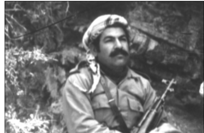
فه‌له‌که‌دین کاکه‌یی، چۆمان - ده‌ربه‌ند، به‌هاری ۱۹۷۴