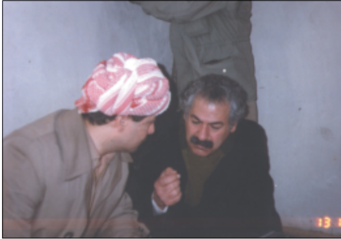
دوای به‌ستنی کۆنگره‌ی ده‌یه‌می پارتی ۱۹۸۹ سەرۆک بارزانی و فه‌له‌که‌دین کاکه‌یی