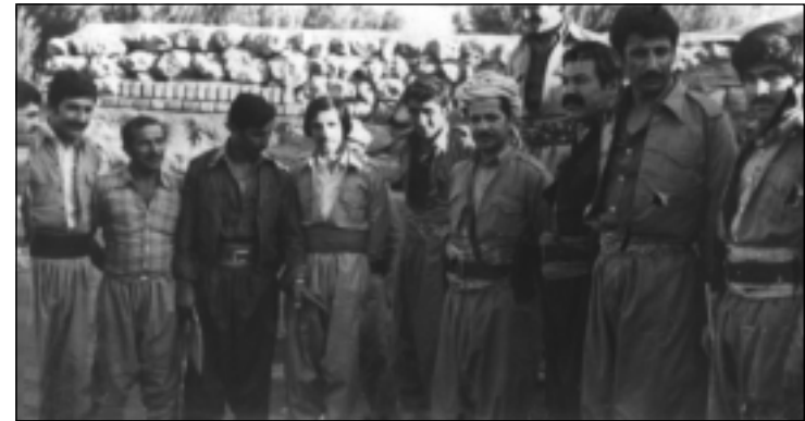
سەردانی سەرۆك بارزانی بۆ باره‌گای ئینزگی دەنگی كوردستان هاوینی ۱۹۸۰ له راسته‌وه: ئەحمەد بریفكانی، فەلەكەدین كاكهیی، سەرۆك بارزانی، هاشم ئاكرهیی، سەباح بەیتوللا، سەلاح بەرواری، سەدیق، وه‌لید ئاكرهیی، قادر هەسەن، تەحسین دۆله‌مەری له دواوه دیاره.