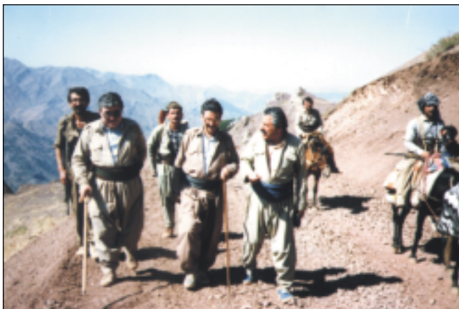
ریگای خواکورک تابی ۱۹۸۷ لہ راستہوہ: فہلہ کدین کاکہیی، سامی عہدولرہ حمان، د. فوناد مہعوسوم