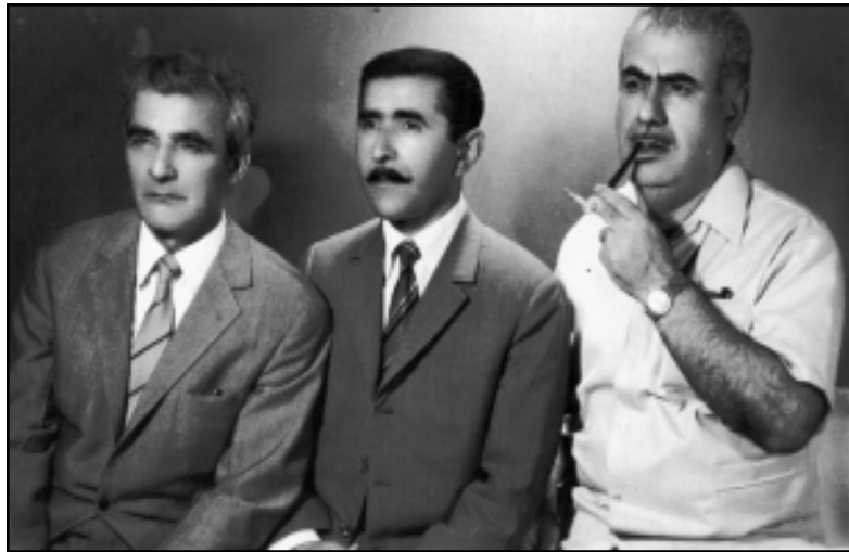
له راسته وه: هه ژار - محهمه د مه ولوود مه م - هيمن

خاله باس يادى به خيئر نه وده مى دايقى مردبوو ههروه ها وشك و برينگ نايه قه بر نه يشردبوو دييه كه ي ئيمه هه مووى ديم و ته لان و گرد بوو ئاو نه بوو نه وده مى هيمن مه له وانى كورد بوو ئاو شوكور زوره وهرن زوو مه له وان من چبكه م؟