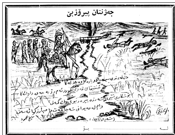
نمونه‌یهک له کارتتی جهژنی نه‌ورۆز که به‌شیر موشیر چاپی کردووه