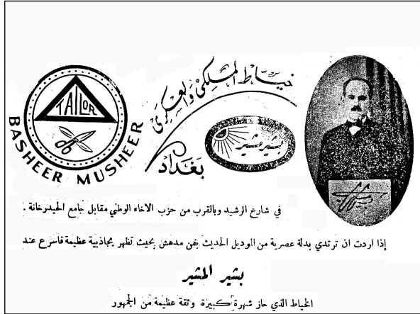
ريكلامي دوكانه كهى به شير موشير ١٩٣٦