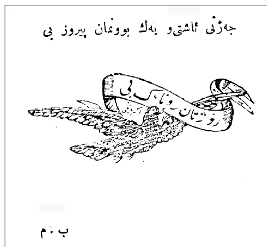
نمونه‌یهک له کارتتی جهژنی نه‌ورۆز که به‌شیر موشیر چاپی کردووه