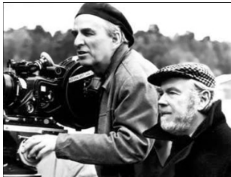
بیریمان و سٹین نیکفیسٹ