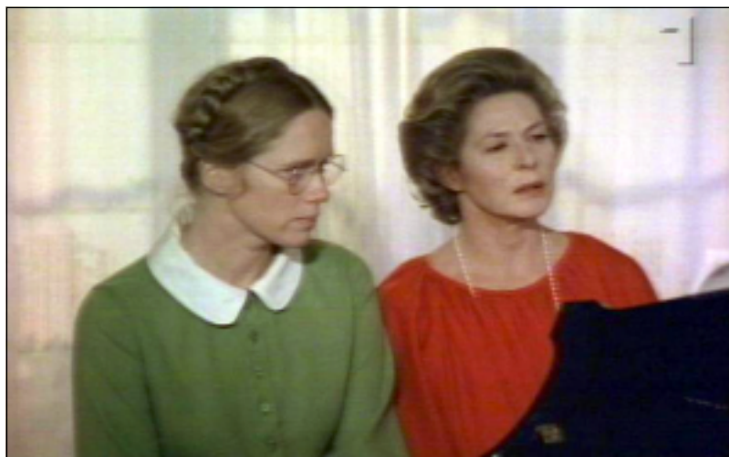
فیلمی (سؤناتای پاییز)