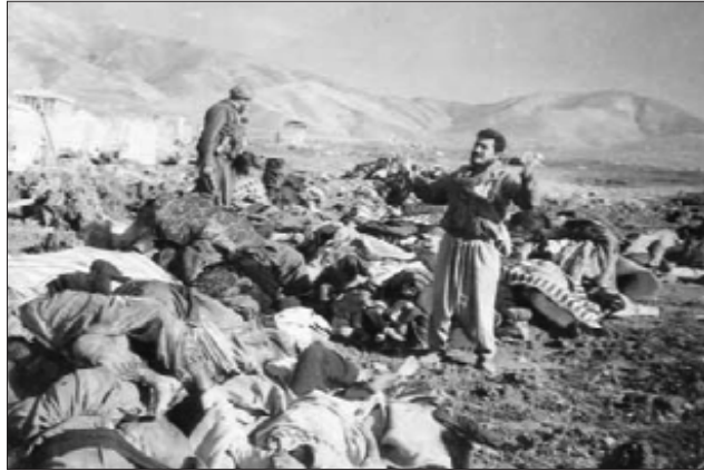
کارهساتی هه‌له‌بجه له سالی ١٩٨٨