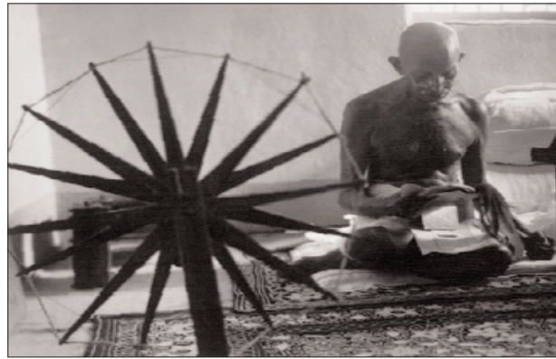
سالى ۱۹۴۶- گاندى و چەرخى پىسینەوہى