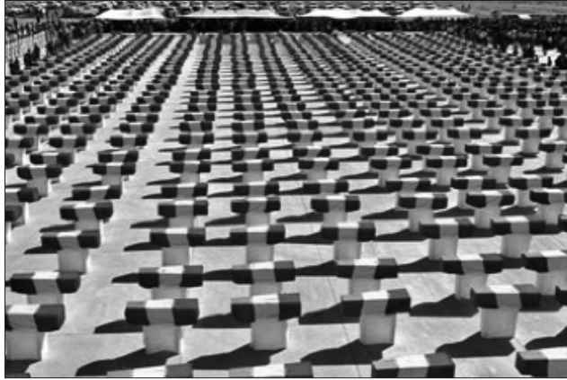
مهراسیمی پیشوازی له تهرمهکانی کارهساتی ئه نفال