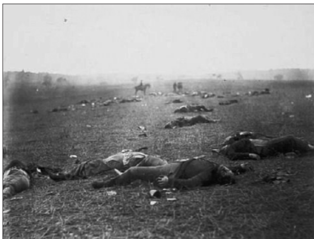
رۆژى يەكەمى شەرى سالى ۱۸۶۳ لە گىتيزبيرگ - پەنسىلڧانيا - ئەمريكا