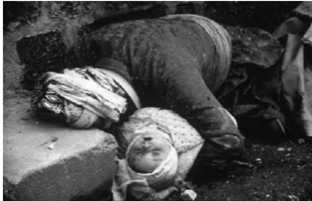
كارەساتى ھەلەبجە لە سالى ۱۹۸۸