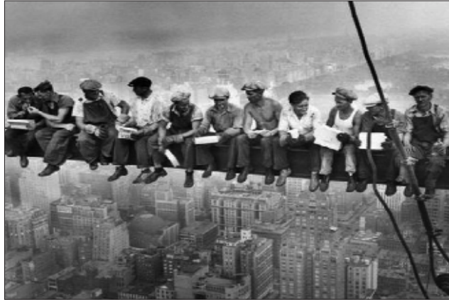
سالى ۱۹۳۲ - فرافين له سەر بالەخانەيەكى ئاسمان پرووشينەر - نيويۆرك