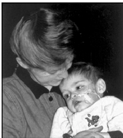
کارولین له گه ل نارسه ری کوری