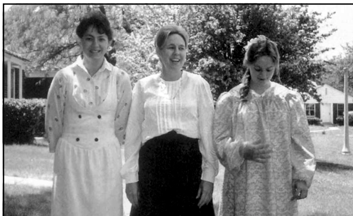
نوسه رمه که له گه آدایکی و لیندای خوشکی