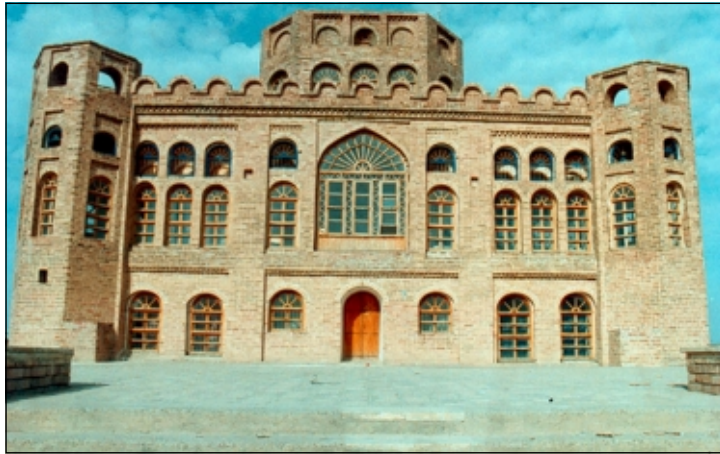
له قه لای شیروانه (کفری) (۱)