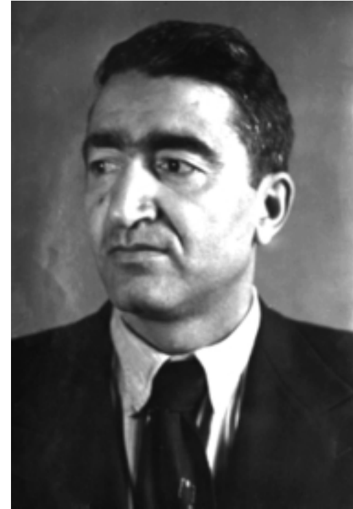
حەجیبی جندی (١٩٠٨ ک ١٩٩٠)