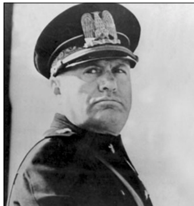
موسۇلىنى Benito Amilcare Andrea Mussolini

موسۇلىنى يەكەمىن كەس دەبى، كە داواى ئەو دەكات، كە ئىتالىا لەگەل ھاوپەيمانەكان بەشدارىي شەر بكا. ھەرۇھا دژى كۆمۇنىستەكان و سەندىكا كرىكارىيەكان دەوہستىتەو. ھەر بۆيە ھەوالگىرى بەرىتانىايى پتوھندىي پتوھ دەكەن. ھەفتانە ۱۰۰ پاوھندى دەدەنى. بەپىيى سايتى Wikipedia ئەم ۱۰۰ پاوھندە پارەيەكى زۆر بوو بۇ ئەو كاتە. بەپىيى ئەمىرۆ دەكاتە نىزىكەى ۶۴۰۰ يۆرۆى