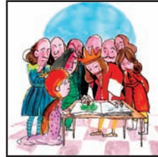
هاقیبونی دارخورمایهک ل ۳۰