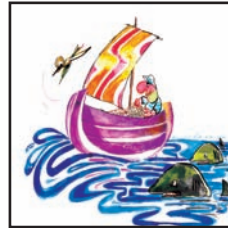
پیربوونی بهلهمیک ل ۵۰