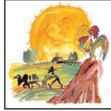
که نه شیریک مان ده گری ل ۱۸