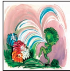
گوئیش نیشتمانی خوی ههیه ل ۴۴