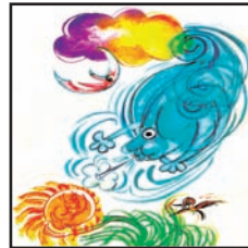
گون و مانگ ل ۵۶