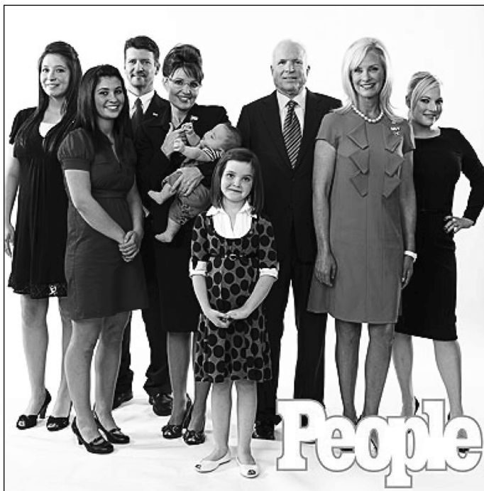
بنه‌ماله‌ی ماکین و سارا و ختیزانه‌که‌پان