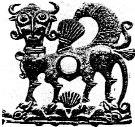
لە خاویكى مسین ھەزار سال پینش زایین

كە چال كراوه يان دھفر و گۆزە و كووپە و دەورپە بەردىنى جۇراوجۇر. لە پروى مېژووھە رەنگە ئەو گۆرانە ھى سەردەمى «ئوروك» بى يان سەرەتاي سەردەمى «برونزى لورستان». دوا كۆمەل و دەستەي كەلەپوورناسان كە چوونەتە ئەوى ئەشكەوتەكانيان ھەلكەندووه و پشكنىپە لە سەردەمى «پەھلەوى» دا بووه بە سەرۇكايەتپى پرۆفيسۆر ماك بورنىي مامۆستاي زانكۆي كەمبىرىج بووه كە لەو گەشتەدا زۆر لە وینە ھەلكەنراوھكانى سەر تاشەبەردى ساغ كردووھتەوھ و بەوردى نیشانەي سەردەمى «پالئولتېك و نئولتېك» ى دۆزىوھتەوھ.