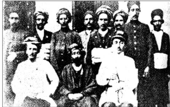
نظر على خان تهرهانى دهسه لاتدارى ناوچه کانى دلفان و جکنى له ناوه راستى کورپه کانيدا دانيشتووه

شاه روسته م برايه کى ترى هه بوو به ناوى (محمدى) که پيوسته له شوڤش و بيگره وه رده دا ده بى، ناچار له گه لى ريك ده که وى که ئهو پشت کوڤه به ريوه ببات، ئه ميش پيش کوڤه. سه رته نجام له ريگه ي فه رماندارانى سوپاي قزلباشه وه شاه روسته م پيلانتيک بو براکه ي پيک ديني و ده ستگيرى ده که ن و به قول به ستروى