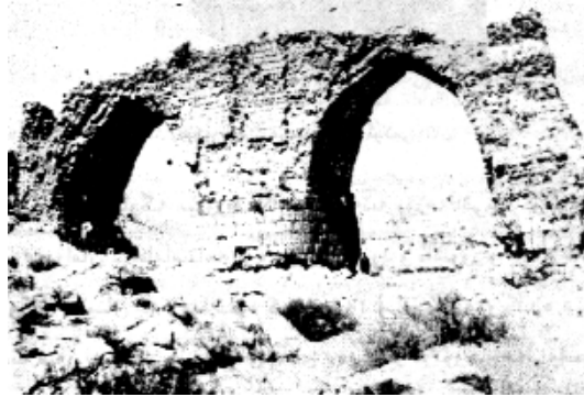
باشماوہی پردی گامیشان

دەسەلاتى (تىگلات نىن) شای ئاشوور ۱۲۲۸ پ. ز فەرمانرەوای ناوچەى بەلخ و بە ئەمىرى برىك لە ھۆزەكانى ماد ناسراوہ و ناوچەكانى ترى ماد باجدەر و فەرمانبەردارى دەسەلاتى ئاشوورىيەكان بوونە، نەك ھەر ئەوان بگرە عىلام و كوردەكانى زاگرۆس و ئاراراتىش ھەر ھەمووان لە ژىر فەرمانى ئاشوورىيەكاندا بەشەر ھاتووە و شەرپەكەى دۆراندووە و دەستگىر كراوہ و دوور خراوتەوہ بۆ شام و سووریا، ناكرى ئەو بە دامەزرىنەرى دەولەتى ماد بناسىن.