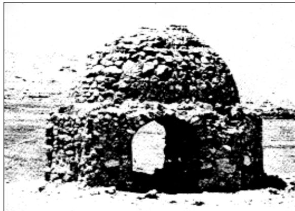
ئاگردانىكى سەردەمى ساسانىيەكان

سالى ۶۲۴ز سوپای كورد لەگەل لەشكرى ئىران لەگەل ھىراكليوس «ھىرەقل»ى قەيسەرى رۆما دەكەونە شەپەو، بەرانبەر قەيسەر شەپ دەدۆرپىن و راپ دەنرىن. بۆ جارى دووہم قەيسەر لەشكر دئىئىتە سەر ئىران و كوردستان دەكەوئىتە ژىر سمى ئەسپى سوپاكەوہ، زۆربەى زۆرى شار و دىھاتى كوردستان دەسووتىنى. (ئىنسكلوپىدىيائى ئىسلامى - بەرگى دووہم، لاپەرەى ۱۰۳۴)