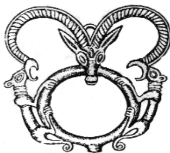
زێوه ئالاتی دۆزراوهی دوو هەزار سال پێش زاین

سێیەمین دەوره لە نیوان سالانی (٨٥٢ تا ٥٥٠) ی پێش زایندا، واتا سەردەمی دەسەلاتی «ماد» تا پەیدابوونی کە یخوسرەوی گەرە «سیروسی گەرە» کە دەولەتی ئێرانی دروست کردووه و مادەکانیش لەو حەلەوه لەسەر ئێران ژمێردراون.