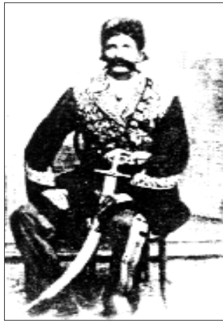
غولام پهزا خانی والی ئاخیرین والی لورستان

توانی له بهندیخانه پا بکا و خوی بگه یه نیتته لورستان و له ویرا سویا و سانیکی گلیر کردهوه و ئاماده بوو بۆ بهر بهر هه کانی له شکره ئه فغان. له بهر پووچی و بووده له یی شاه سولتان حوسین له شکره ئه فغان له تهواوی شه ره کاندایا سه رکه وتوو بوون و عه لی مهردان خان له شه ردا بریندار ده بی و دوو کچی شان به شانی باوکیان له شه ردا به شدار ده بوون ئازایی و سوارچاکیان ناووباویکی ده رکردبوو. به برینداری ده گه ریته وه بۆ لورستان، له ویرا دیسان ده که ویته وه ته قه لای له شکر گلیر کردنه وه، هه یچ کهس ئاماده ی یارمه تی نه بوو. قاسم خانی به ختیارای که له گه لیدا ناکوکی دیرینی هه بوو ده ی توانی پیکه وه به ری له شکره ئه فغان بگرن، به لام نه رۆیشه ژیر نه و پێوه نده وه و خوی به ته نیا به ۱۲ هه زار سواره وه چوه مهیدانی شه ری مه حمودی ئه فغانه وه و زوری نه کیشا له شه ردا شکا و بۆی ده رچوو. خیانته ی یه کێک له براکانی بوو به هوی بی هیزی و ئاشوفته گی زۆرتری عه لی مهردان خان. له لایه کی تره وه سوپای عوسمانی گه یشته ده ور به ری خورهم ئاباد. عه لی مهردان خان فه رمانی دا که شار به جی