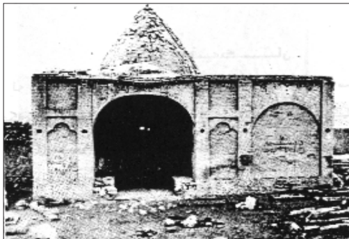
گومه تی ابو الوفا

(فضل الله) له سالی هه وتسه د و چلی کۆچه ریدا له دایک بووه و به کهوا دوورین ده ژیا، له پرووی ره وشت و هه لسان و کاروبار و رهفتاره وه به باشی ناوبرابوو و ناسرا وه به (فضل الله) ی هه لآخوور، له سالی هه وتسه د و هه شتا و هه شتا بیرو رای ئاینی خوی ئاشکرا و دهستی به بلا و کردنه وهی کرد و که وته ته قالا. له سالی هه وتسه د و نه وه د و هه شتا که خه ریکی دانانی کتاویک بوو به ناوی