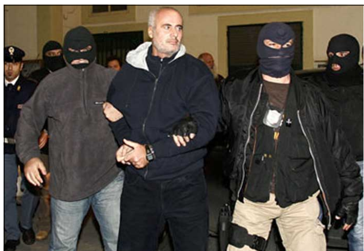
دهسنگيرکردنی که سڼکی ديکه له گه وره مافياکانی ئيتاليا