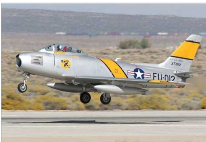
به کارهینانی فرۆکه له لایه ن گروپتیکی مافیا