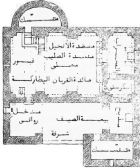
قدشانس: بيعة مار شليطا

العجين الذي سيخبز للقداس التالي، لا لتناوله ولا لاجل العبادة، وعملية خبز القربان كما هو عادة عند الشرقيين يقوم بها الكاهن نفسه داخل الكنيسة في موضع خاص قريب من المذبح، فما يلبث العجين المخمر المدخر الممزوج به ان يخمره ويجعله بحالة «الاتصال» مع الفضلة التي استعملت في كل القداديس السابقة التي تتسلسل حتى تتصل باول تقدمة مسيحية وهي «العشاء السري في عليية اورشليم». هذا الافتراض لا يمكن اثباته ولا انكاره من الناحية التاريخية، اما العملية نفسها فنرى انها مما لا يمكن الاعتراض عليه من الناحية الدينية على اقل تقدير، في حين ليس ثم من يحسداهم على ملكيتهم هذه.