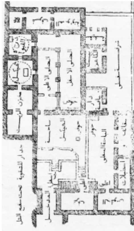
معبد اليزيدية في الشيخ عادي (ادي)

اثنين من حراسنا (المصيبة انهما مسلمان!) عاكفين على شرب العرق 33 احتفاءً بعودتهما الى الموصل. وعندما اخذنا نؤنبهما اعتذرا لنفسيهما بالقول: - هذا كله من خطئكم (يا افندم) فانتم افسدتم روحنا الطاهرة بأخذنا الى مسكن ابليس. وهذه المصيبة حلت بنا جراء ذلك، لقد لمسنا القار الاسود فتلوثنا.