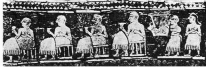
المأدبة السومرية - متحف لندن