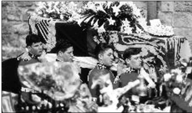
روژي گول له لهنده ن

تشارلز به هه ردوو کوره که ی وت، من به ره و فه رهنسا دهچم بو هينانه وه ی ته رمی دايکتان ئيوه ش له گه ل خو ما نابه م.