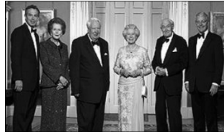
شاژن له‌گه‌ڵ ژماره‌یه‌ک له‌ سه‌رۆک وه‌زیرانی پێشوو‌ی به‌ریتانیا

تاجه‌که‌ی ئالیزابیث له ساڵی ۱۹۳۷ داریژراوه‌ته‌وه، پێشتر چه‌ندین پاشای تر له‌سه‌ریان داناوه، بۆ شاژن فیکتۆریا له ساڵی ۱۸۳۸ داریژراوه‌ته‌وه، پاش ئه‌و ئادواردی هه‌وته‌م و جۆرجی پینجه‌م له‌سه‌ریان داناوه، له ساڵی ۱۹۳۷ بۆ جۆرجی پینجه‌م ئه‌و شیوه‌ی ئیستای له ساڵی ۱۹۵۳ وه‌گرته‌وه. پاش ئه‌وه‌ی که‌میک نه‌وی کراوه‌و ۲۸۰۰ پارچه‌ ئه‌لماسی تازه‌و ۱۷ به‌ردی زفیرو ۱۱ زهمرودو ۵ یاقووت و ۲۷۳ ده‌نکه‌ لوئوئی بۆ زیاد کراوه.