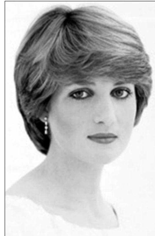
دیانا به کەس تێر نەدەکرا