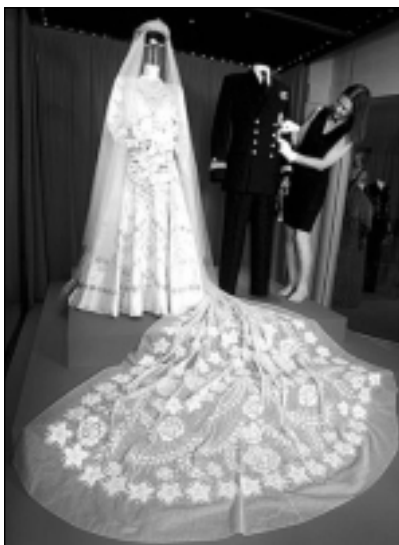
فستانی بووکینی شازن به درێژی ۱۳ پی

له یادی ۶۰ ساله‌ی بووکینی ئالیزابیثی دووهم له پرنس فیلیپ، پیشانگایه‌ک بۆ کهنجینه‌ نازداره‌کانی ده‌کریتته‌وه. ئه‌و فستانه‌ی بووکه‌که له رۆژی ۲۰ ی نوڤمبه‌ری ۱۹۴۷ له‌به‌ری کردبوو، یه‌کێکه له کهنجینه‌ نایابه‌کان. به جوانترین فستانی بووکینی له جیهان ده‌ژمێردریت، چونکه ئه‌و فستانه شتیکی ئاسایی نه‌بووه، به ماوه‌یه‌کی کورتیش نه‌دوووراه، به ۱۰ هزار به‌ردی یاقووت و به‌ردی گرانبه‌ها کراوه. (نورمان هارتنل) دیزاینه‌ری بووه، بیروکه‌که‌ی بۆ (تابکۆی بریمافیرا) ده‌که‌ریتته‌وه، که هونه‌رمه‌ند (بوتشیللی) له سه‌ده‌ی یازدهه‌م دروستی کردبوو. تابلۆیه‌که سونبلی که‌رانه‌وه‌ی ژیانه‌ پاش شه‌ر، ئه‌وه‌ش له راگه‌یاندنیکه ده‌سته‌ی رۆژنامه‌گه‌ری پاشایه‌تییه‌وه ئاشکرا کراوه، رهنگه‌ سپییه‌ عاجییه‌که‌شی بۆ ئه‌و سه‌رده‌می پاش شه‌ره‌که، که شازن له سپی به‌فرین دوور کهوتیتته‌وه، ده‌که‌ریتته‌وه.