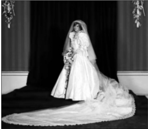
دیانا له ۲۹ ی یولیوی ۱۹۸۱