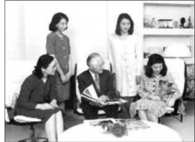
ماساکۆ دوا دیداری ماله وه بیان به رهو کۆشک