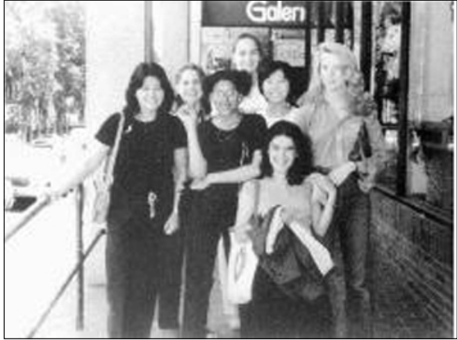
ماساكو له گه ل هاو پتيه كاني