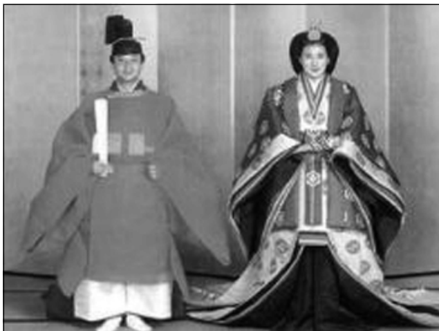
بووك و زاوا به جلى تهقليدى ئيمپراتوريهت