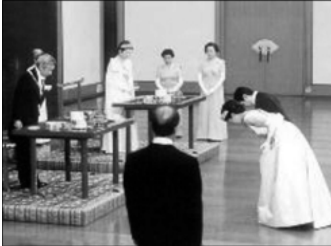
بووک و زاوا کرنۆش بۆ ئیمپراتۆر دهبن