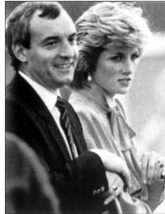
دياناو پاسهوانهكهى ماناكي

پرینس تشارلز له پشووہکانی کوٹایى هفتهدا، له هايجرؤف لهگهٔل كاميلاي دؤستى دهمايهوه، دياناش لهو ژووانانهى ميتردهكهى ئاگادار بوو. ئەو دهيزانى كاميلاي له هايجرؤف وهك له ناو مالهكهى خؤى بيت، ئاوا ديسورپتتهوه. دلنپاش بوو له وهى پهيوهندي ئەو به ميتردهكهى زؤر دووره له برادهرايهتى. جوانييهكهى ديانا لهو مهسهلهيهدا وهك چهكيكى لاواز بهكارهاتووه. رؤژانهش رهوشه دهروونييهكانى ديانا بهرهو خراپى دهچوو. پاسهوانه تاييهتاييهكهشى بارى ماناكي، بهردهوام هاورپى دهبوو، ههروهها خهفتهى گهورهشى ئەوهبوو، ههردوو جگهركؤشهكانى ويلىام و هارى زؤرتى ئارهزوويان بوو لهگهٔل پاسهوانهكه بمينينهوه، ههزيان له لاي دايك و باوكيان نهدهكرد. ئەوان چهندين نهپنى ژيان و رؤژانهى كاميلاي نازارى كوشندهيان ديدا.