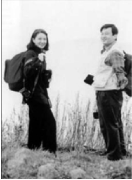
بووک و زاوا له سهیرانا