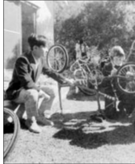
ناروهيئو به منالي