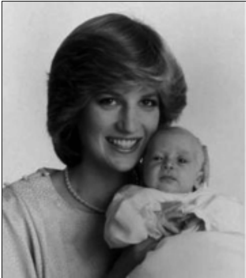
پرینس ولیهم و دیانا- یولیوی ۱۹۸۲

میژووویییه که ی گری دهدات، ئەو سیستهمه یه ولاته که له ناو ئەو گیتراوه سهخت و گۆرانکاری و دژوارهی جیهان ئارام رادهگریت.