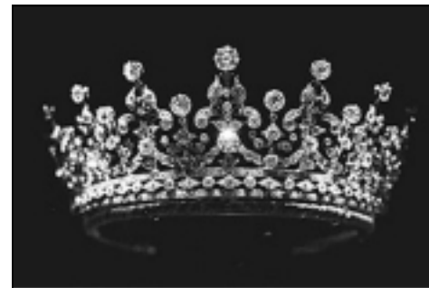
ئەو تاجە بوو شاژن ماري لە بووكينى كیژەكەى پيشكەشى كردبوو

سالانە ھاوينان ۱۷ ژوورەكەى كۆشكى پاشايەتى بۆ خەلك دەكریتەو، نمايشەكانيش پەيوەست دەبن بە ميژووى بنەمالەكە، پەيوەندى بەريتانيا بە ولاتانەو دەبەستیتەو. لە يادى ۶۰ ساڵەى ھاوسەرييان ھەرچى گەنجينەى زېرو زيو ھەيه نمايش دەكرين، يەكێك لەو دياريانەش ئەو دانتیلەيه كە بە دەستى خودى (مەھاتما گاندى) يەو رىستراو، ئەو دياريانەى لە دايك و باوكیيەو بە ديارى وەرى گرتوو، وەك گەردانەى ياقوت و ئەلماس.