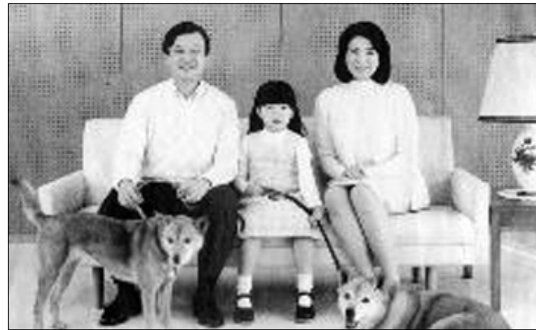
پرينس و پرينسيس و كيژهكهيان