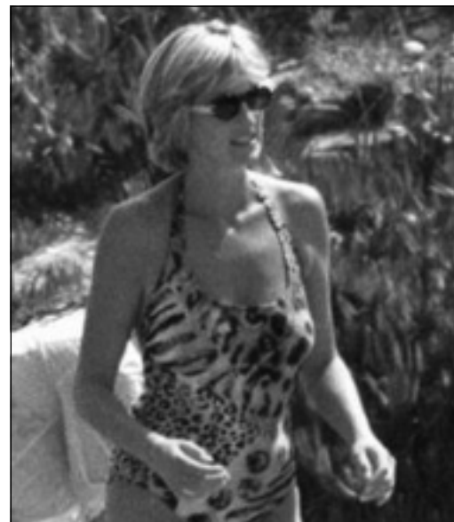
دیانا مه‌له‌وانی ده‌کات. ۱۴ ی یولیۆ ۱۹۹۷