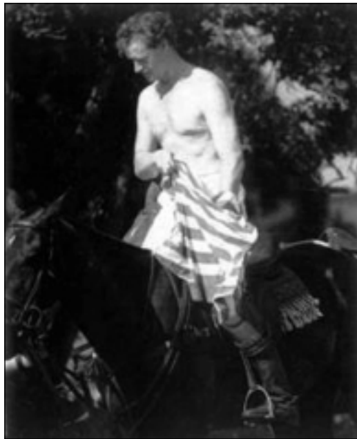
جیمس هایت، به زانیی میرده که ی ببووه دۆستی دیانا

هاویت کتیبیکی به ناوی (ئه فین و شهر) له سالی ۱۹۹۹ بلاو کردبووه، له وێ به ئاشکرا نووسی بووی، ئیمه هه له یه کمان کرد، که یه کترمان خوشویست. ئه و دوو که سه هه له ی زۆرتریان کردبوو، سه رته هاویت نوایه کی ئارام و هیمن و پشوودان بوو بۆ دیانا، ئه و ههستی به نه خوشی بولیمیا ده کرد، که سیکی خوشه ویست نه بوو، ئه و ژنه پیویستی به باوه شیکی ناسک و ئارام هه بوو، ئه و سۆزه ی له لایه ن میرده که ی پی نه درا، پرینسیسه بزیه که ی ویلز په یوه ندیه کی گهرمی ده ویست. به لام هاویت وه ک ماناکی به ریکه وت ئه و ژنه ی خوش نه ویستوه، ئه و ئه فینه به نامه ی بۆ داریژرابوو، میرده که ی ری بۆ خوش کردبوو.