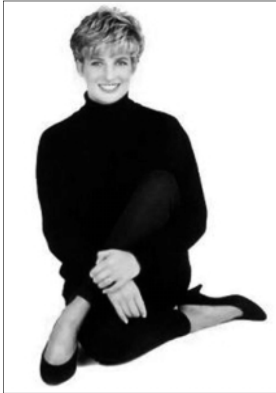
ديانا مرد، يان كوژرا...!

(مارگریت تاتشر) دوازه سال و (جۆن میچهر) ههوت سالان له حکوم مابوونهوه. هاتنه پێشهوهی کهسایهتییهکی وهک تۆنی بلیر، ئەگههه ری گوڤران و نوێکاری سیاسی بوو له مهیدانی سیاسهتی ئەه و لاتهدا. سهبارهت به بنهمالهی پاشایهتیش، شازده سال بوو، ئەه کیژه ناسکه گهههه جوانه خوشهویسته چالاکه، هاتبووه ناو خیزانهکهیان نهیاندهتوانی وهک کهسیک، وهک ئەندامیکیان وههه بگرن، ئەوهش باشتهر بوو لهوهی له پاش دانانی تشارلزی دووههه بۆ سهه تاجی ئەه و لاته تووشیان هاتبوو، که دووباره نهبیتههه.