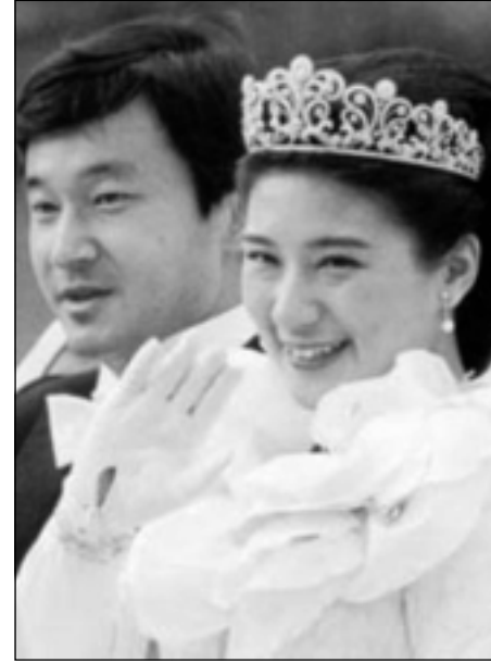
بووک و زاوا سلاو له میوانه کانیان دهکهن