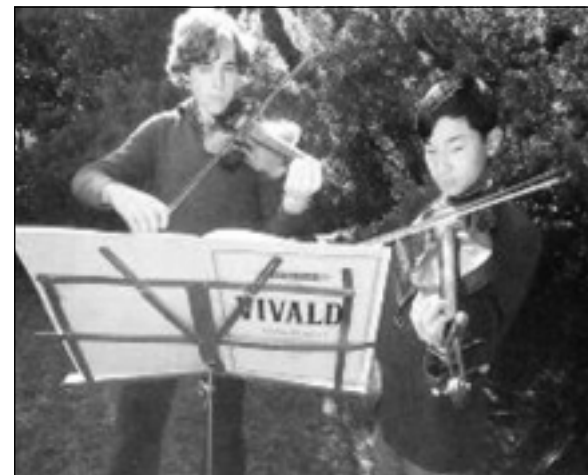
ناروهيئو و ئادم هاربرى هاوپتى كهمانچه دهئنهت