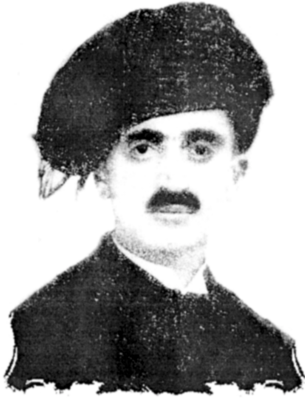
ئەحمەد موختار جاف