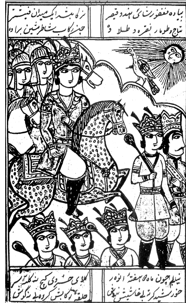
دهست خت و وینه ییکی قهله مکیشی حهیدر بهگی بهرازی