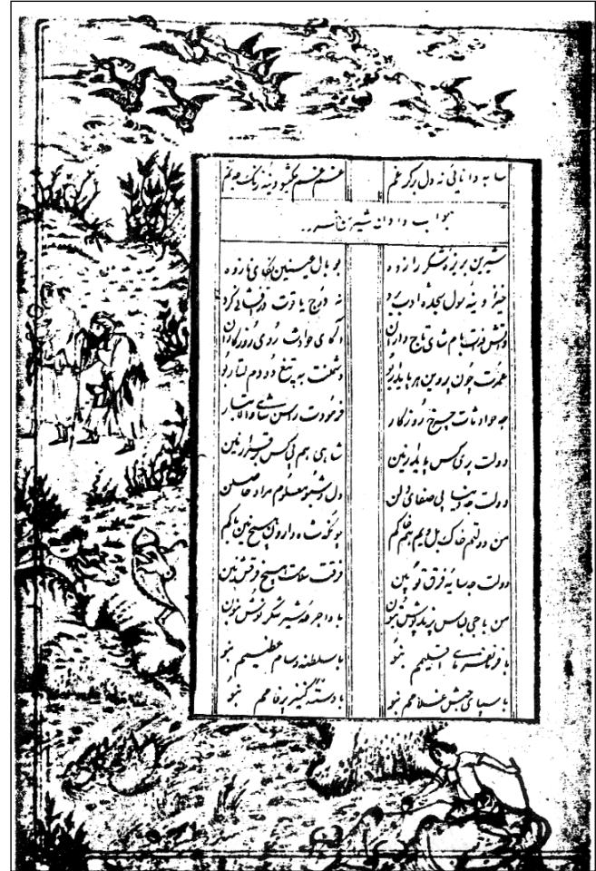
نموونهی دستخهتی لاپه ریه کی خاسره و شیرینی میرزا عهبدولقادی پایوهی