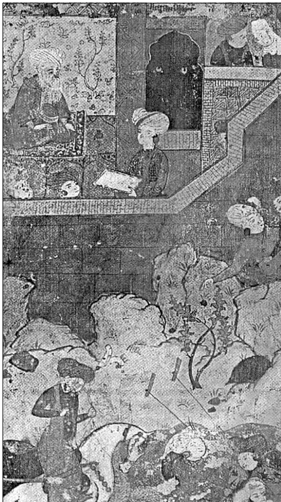
جزیرا بۆتان و مه‌م و زین