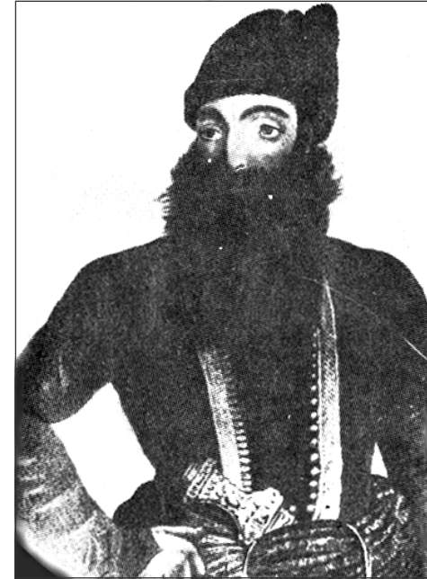
عەباس میرزا (۱۷۸۹ - ۱۸۳۳)

پرسیار و وەلامتیکیش بۆ سەرانی هەمیشە پایەداری دەولەتی سۆلتانیی نەماوەتەوه، جگە لەیەک بەند نەبێ، کە لە دوو تووتیی ریکەوتننامە پیرۆزەکەدایە و سەبارەت بەئێلەکانی «سیپەکی و حەیدەرانیلو»... بەمەش ریز لە شان و شکۆی دەولەتی سەرلەندی عوسمانی گیراوه... لە کاتی کەدا دەبوابە بەرابەری و ریککەوتن لە نیوان دوو دەولەتی ئیسلامدا، بەگوێرە هاشانی و چوون یەکی ببوابە... کەچی ئەمە، نەلای ئەو جەنابە و نەلای نوێنەر و کاربەدەستانی ئیمەش لەبەر چاوەگیراوه.