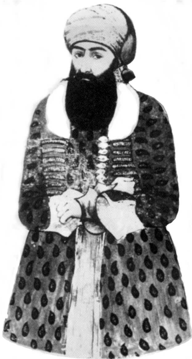
نوردهحمان پاشای بابان (؟ - ۱۸۱۳)

نهم و پنه‌یه‌م له‌م کتیبه فارسییه‌وه وهرگرتووه: سرنویشت درگذشت زمان، نویسنی: عبدالحالق اردلان، چاپ اول، تهران ۱۳۵۸ ی هه‌تاوی ۱۹۷۹ ز