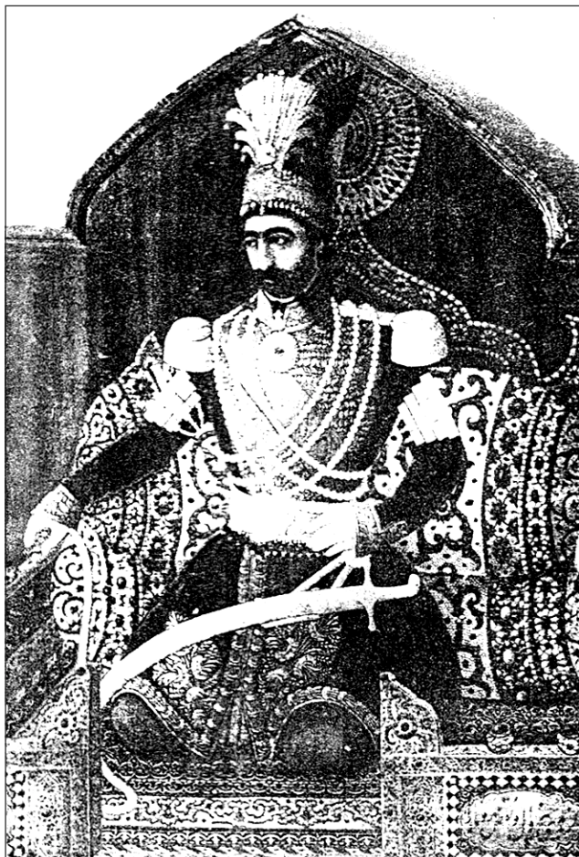
محهمه د شا (۱۸۳۵-۱۸۴۸)ز

یهکهمی ئهزره رۆم و مایه ی خا و کردنه وه ی گرزیهه کانی نیوان دهوله تی قاجاری و عوسمانی. محهمه د شای قاجاریش له سه ره تای سالی ۱۸۴۸ز، دا مرد... (۱۷)