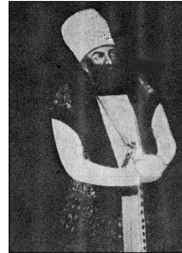
ئەمانوللاخان ئەردەلان* (۱۷۷۵-۱۸۲۴ز)

خەسرەوخان کاتی ئەم دیدەن بیهی محەمەد حەسەن خانى قاجارى کرد، که هېشتا مەملانیتى دەسەلات لە نیتوان کەریم خانى زەند و دۆژمنەکانیدا (که یەکیکیان محەمەد حەسەن خانى قاجار بوو)، بەلایە کەدا نەکەوتبوو... بۆیە ئەم هەلۆتستەى خەسرەوخان بوو، مایەى پیتزانینى بنەمالەى فرمانرەواى قاجار و تا محەمەد حەسەن خان لە ژباندابوو، چەند جارتیکى تریش نامە و دیارى لە نیتوانیاندا گۆردراو تەو.