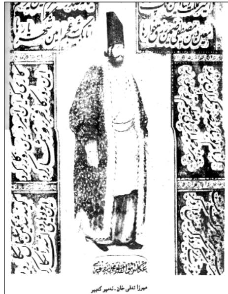
میرزا تەقی خان - ئەمیر کەبیر