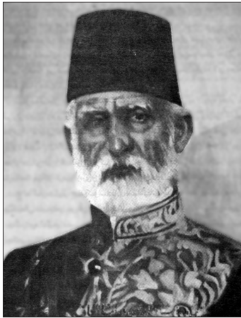
هەمه پاشاى جاف

– بۆچى وا دەزانيت ئەم سەردەمه، سەردەمى ئاژاوه بازارپيە؟ – ئاژاوه بازارپيش نەبى هەردەم لەسەر پايه، تا ببىتە ئاژاوه بازارپى. – والى نازانى ئيمە شەرى براكوژيمان پى ناكرى و دەستمان نارواتە خوینی هاوخوینەكانمان، وهك دەزانيت نيوان ئيمە و ئەحمەد پاشاى بابان شەكەر و