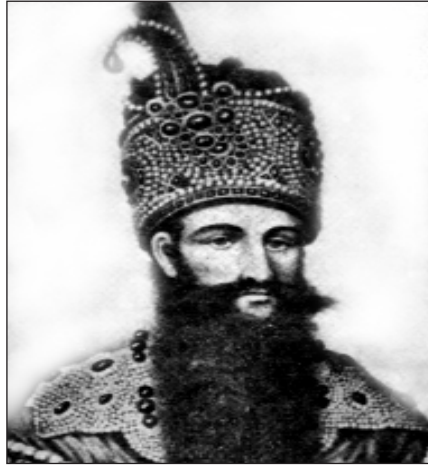
فہتخ علی شای قاجار