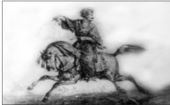
عهبدو لا بهگى جاف و عوسمان بهگى بابان له شهري (گرده گروي) دا