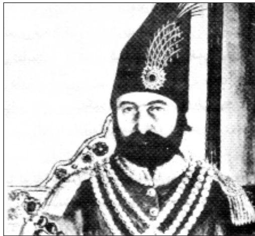
محمہد شای قاجار