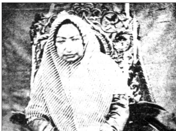
مه‌دولعلیای دایکی ناسره‌دین شای قاجار