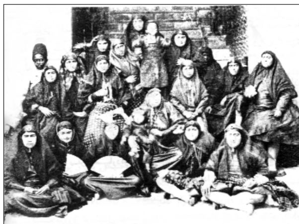
ژنانی حه‌رم سه‌رای ناسره‌دین شای قاجار