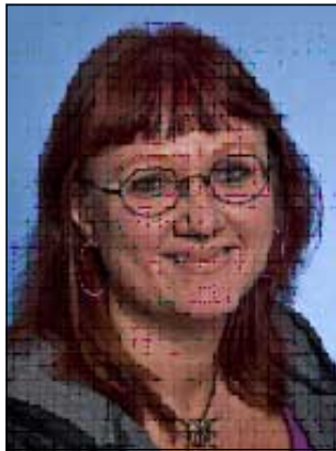
ئينجه لا وادبرينگ

هه مان كفاليتي پيشوو به وهرگر بدرئ. ئينجه لا وادبرينگ پرؤفيسؤر له زانكؤي ناوه پاست له سوندسفال له سويد له م باره وه دهلي: