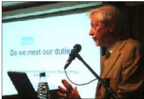
ئولوف كلىبەرى سەرنوسىيارى پيشووى فئىستىربۆتئىن كوريرەن

باشە لە بارودۆخىكى وادا كە گەورهترين رۇژنامەى شارىك دەستى لەگەل شەريكە خانووبەرە و گەوره سەرمايهدارندا تىكەل دەكا و دەبىتە خاوەنى قوتابخانە، زانكۆ و نەخۇشخانە، ئەى كامە رۇژنامە و رۇژنامەفان لەسەر پرس و كيشەى شارەكە بنوسن؟ ئاخۆ لە كاتىكى وادا رۇژنامەكە دەتوانئ رەخنە لە سەرمايهدارىكى وەك يوناس ئولسوون بگرئ كە پىكەوه ئىستا لە قازانچ و دۆراندا هاوپيالاەن؟ ئەى كامە رۇژنامە چاودىرى بەسەر شىوازى كار و چۆنيەتتى كارى پەرودەدا بكا لە كاتىكدا بەشئىك لە پەرودە هەر لە قوتابخانەوه بگرە هەتا زانكۆ ناراستەوخۆ لەلايەن خودى رۇژنامەكەوه بەرپۆه دەچئ؟