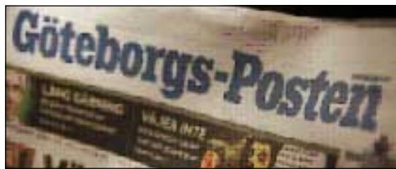
رۆژنامەى یۆتۆبۆرى پۆستین

نرخى رېكلام دینامیکى بەكەم جار لە سوید لەلای بەكك لە رۆژنامە ھەرە گەرەكانى بەیانىانى سوید، بە ناوى یۆتەبۆرى پۆستین ۲ بە كردهوہ