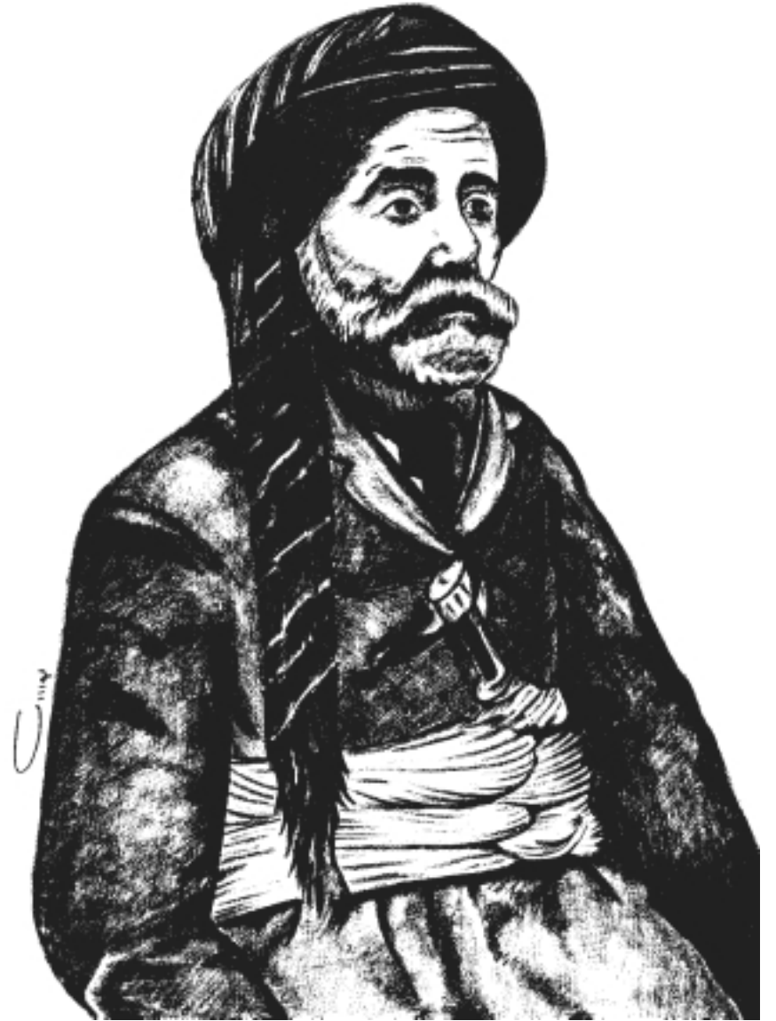
ھاجى نۇنىقى پىرەھىيە