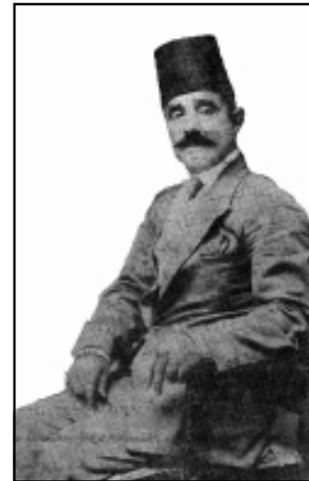
وي نه ي پيره ميترد له ته مه ني لاويدا له توركي ا

نه كرا وه. پيره ميترد له سالي ۱۹۳۶ دا له ژي ر ناوي (به راورد ي نه ده بيتا تا) له ژماره ي (۴۶۳) ي (ژيان) دا، كورته با ستيكي ئەم به راورده ده كات. شيعريكي عه ره بي و كوردي و توركي و فارسي، و اتا نه دبياتي چوار نه ته وه به راورد ده كات، كه نه و چوار شيعره له لايه ن چوار شاعيره وه بۆ يه ك