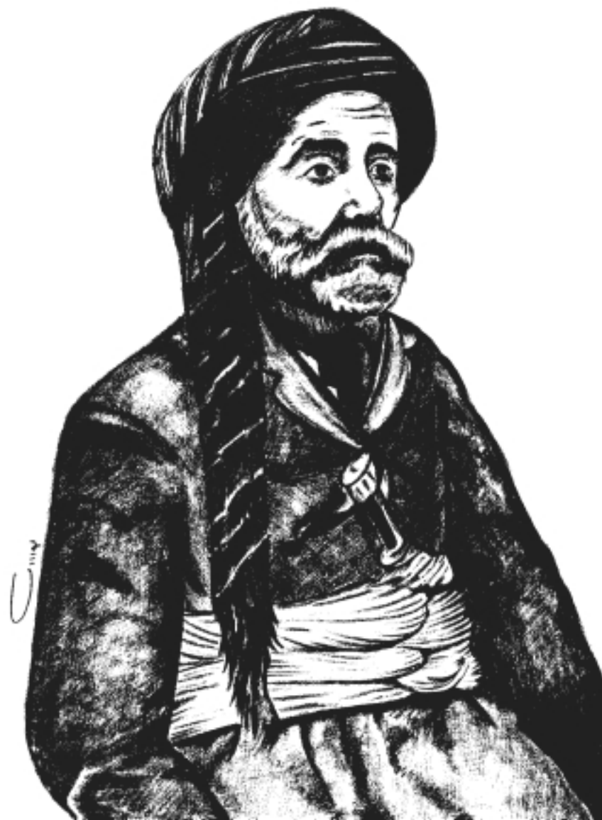
ھاجى ئۇنىقى پىرەھىردە