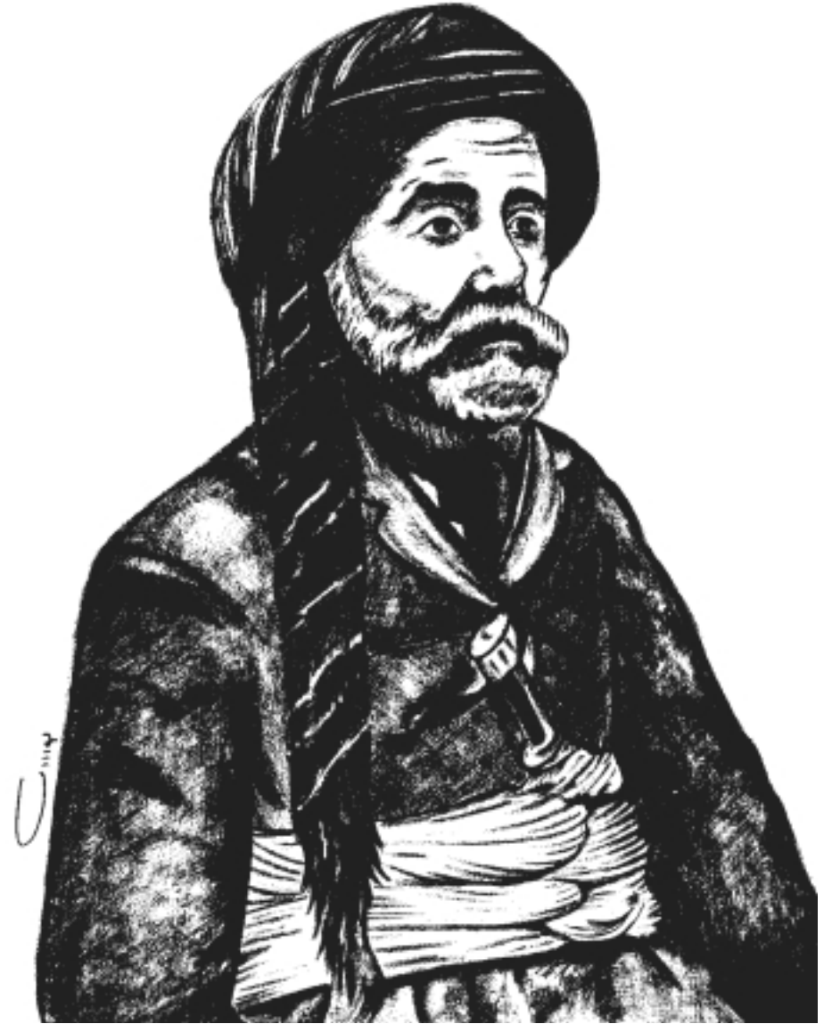
حاجى تۇنىقى پىرەمپىرە