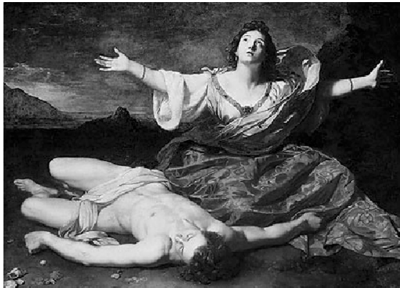
هیرۆ که تەرمهکهی لیندر دەدۆزێتەوه، وهکو چۆن

هیرۆ و لیندر، ژن و پیاوێک بوون. یهکتیریان زۆر خوشدهویست. هیرۆ، بانووکەشیش (۱) بوو له پهرستگای "ئەفرۆدایت Aphrodite" لهسەر کەناری تەنگاوی "دەردەنیل" (۲) له شاری "سیتستۆس Sestos" له دیوی ئەوروپا. لیندر، له "ئاسیا" دا، له دیوی ئاوهکه، له شاری "ئەبیدۆس Abydos" دا دەژیا. لیندر، ئەوەندە "هیرۆ"ی خوشدهویست، گوێی نەدەدا بەسەرما و گەرما، هەموو ئیوارەبەک، زستان و هاوین، دواى ئەوهی گیتی تاریک دەبوو، بە مەله له دەردەنیل دەپەرایهوه و دەهات بۆ ئەوهی شهوهکهی لهگەڵ "هیرۆ" دا رابووێت. بۆ بهیانیهکهی، بۆ ئەوهی کەس نەیبینیت، پیش ئەوهی گیتی رووناک بێتەوه، بە مەله هەمدیسانهوه دهگهرايهوه بۆ شارەکهی خۆی. (۳)