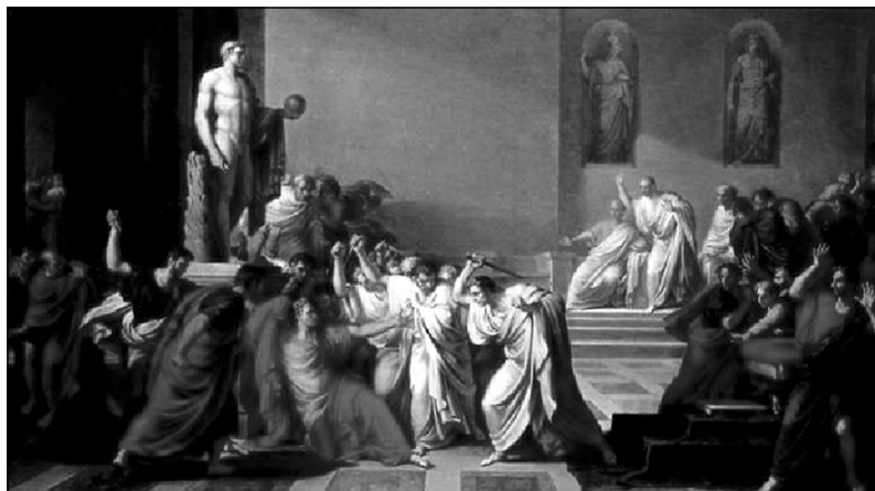
کوشتنی یولیهس قه یسه ر وه کو چۆن

له شوباتی ۱۸۴۴ی پ. ز، په رله مان بریار ده دات که قه یسه ر هه تا ماوه هیزی دیکتاتوری بدریتی. ۱۸ی مارت، قه یسه ر به ته ما ده بیت بچیت بۆ جهنگ دژی فارس. له بهر ئه وه بریار ده دات ۱۵ی مارت په رله مان کو بیته وه بۆ مائناوایی لیکردنی. هاوسوینده کان، بریار ده دن که له و روژدا، له کاتی کو بوونه وه کهدا، بیکوژن. چونکه بۆ ناو خانووی په رله مان ئه وهی ئه ندام نه بوایه ریگی نه ده درایه بچیته زووره وه، له بهر ئه وه قه یسه ر پاسه وانی له گه لدا نابیت. ریکیش ده کهون که هه ر که سیک خه نجه ره کهی له ژیر جله کانی خویدا بشاریته وه و هه موویان به شداری بکهن له کوشتنه کهیدا. وه کو باس کرا، ده مگۆ ده رباره ی ئه م کوشتنه له رۆمادا بلاو بوو بووه وه، به لام کهس نه یده زانی