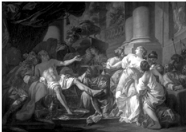
خۆکوشتنی سینیکا، وه‌کو چۆن

دهسووتا و ویران دهبوو، نیرۆن، بهسهرخۆشی، ئەو شیعراڤه‌ی دهخویندهوه که "هۆمیرۆس" و "فیرجل Virgil"، کاتی خۆی دهرباره‌ی سووتاندنی شاری ته‌رواده، نووسیویوان. (۱) شاره‌که که بینا ده‌کریته‌وه، زۆربه‌ی خانووه‌کانی به به‌رد و مه‌ر مه‌ر دروست ده‌کریڤن. هه‌ر له‌ویشدا، نیرۆن، کۆشکیکی نایابی زۆر جوان و مه‌زن به باخیکی گه‌وره‌وه بۆ خۆی دروست ده‌کات. ناوی ده‌نیت کۆشکی "زیرین".