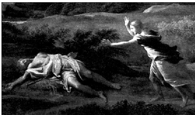
زیسبی که ده گه ریته وه، و پیرانهس ده بینیت خۆی کوشتوو و هه کو چۆن "نیکۆلهس پوسین 1595-1665" Nicholas Poussin "ره سمی کردوون

له دوا ی چه ند روژیک خه لکی شاره که ده بین تووه سپیه کانی داره که، نه خته به نه خته رهنگیان سوور هه لده گه ریت و تامیان مزر و خۆش و شیرینتر ده بیت. ئیتر له ناو خه لکه که دا وا بلاو ده بیت وه که دارتوو پیره که، ناگادار بووه چی له ژیر لق و گه لاکانیدا ئه و روژه رووی داوه. ئینجا بۆ ئه وه ی یادی ئه و ئه قینه پیروژه ی ئه و دوو دلداره، به هه میشه یی بیاریزیت، به خوینی ئه وان به ره کانی خۆی رازاندوو هه ته وه و تامیانی خۆش کردوو. ناوی تووه که ده نین "شاتوو" و تووه کانی له ناوچه که دا بلاو ده که نه وه.