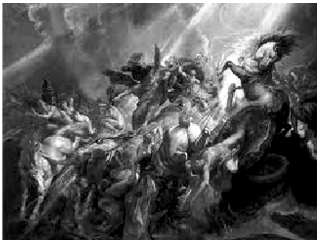
که‌وتنی فایه‌تۆن. وه‌کو چۆن "روبینس 1577-1640 Rubens" "رەسمی کردووه"

فایه‌تۆن، که گالیسکه‌ی باوکی و ئەو چوار ئەسپه‌ جوانه نەمره به‌هیزانه‌ی رایده‌کیشن، دەبینیت، لئی ده‌خوازیت که بهیلێت ئەو رۆژه، خۆی گالیسکه‌که لیبخوریت. فیۆبەس نه‌یده‌زانی که کورپکه‌ی شتیکی ئەوه‌نده گرنگ و گرانی لێ ده‌خوازیت؛ چونکه لیبخورینی ئەو گالیسکه‌یه، یه‌کیکی زۆر پسپۆری گەرکه؛ لیبخورینه‌که‌ی کاریکی ئاسان نییه. زۆر هه‌ولده‌دات له‌گه‌ڵ