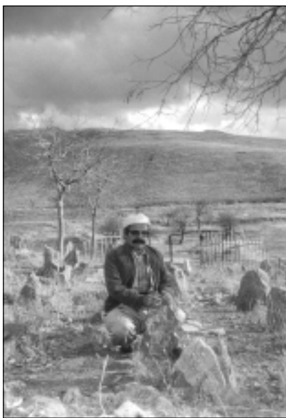
عەزیز شاروخی لەسەر مەزاری سەید عەلی ئەسغەری کوردستانی