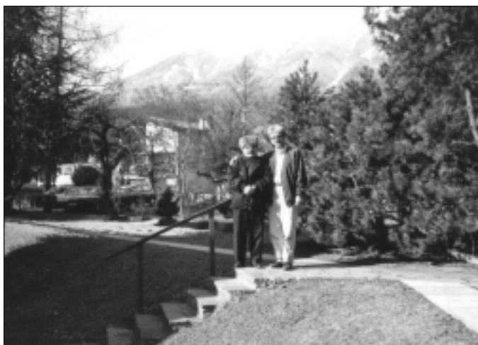
سه عیدی فه رهج پوری و عەزیز شاروخ - ئەلمانیا