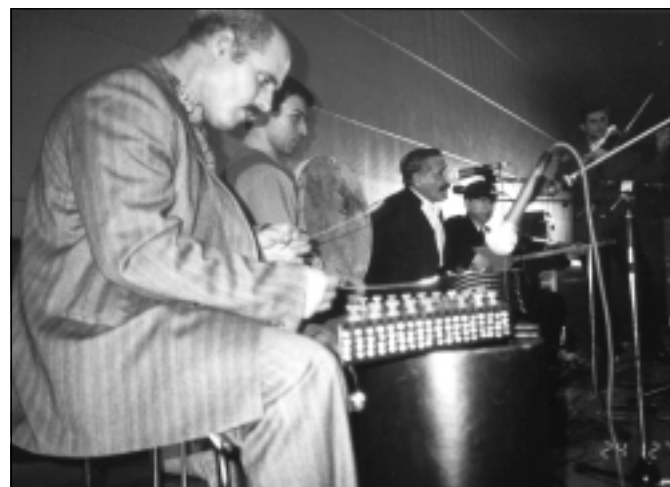
عەزیز شاروخ له کۆنسیرتی سوید