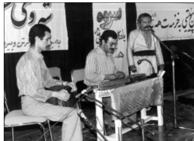
یادی هیمنی شاعیر - مه‌هاباد