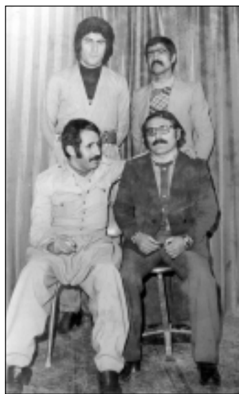
وهستاوه كان: رهزازی و بیهروزی كورده نه حمه دی دانیشتووه كان: عهزیز شاروخ و جه لالی مهله كشا