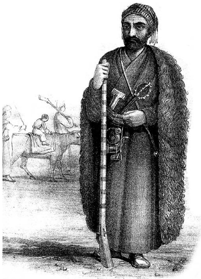
Zilamekî eîra Cafê