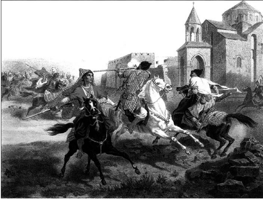
Şerê Kurd û Farsan