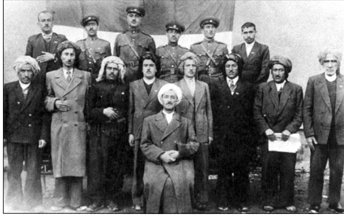
Qazî Mihemed digel navdarên Mihabadê û efsêrên komarê

Xewna welatparêzên kurdan ya bo Kurdistanê serbixwe, bi şeweyekî biçûkirî be jî, li Îranê di navbera meha kanûna yekem a sala 1945 û kanûna yekem a sala 1946 de pêk hat. Bingeha komara biçûk a kurdan, dîroka wê ya kurt û tîjî bûyer û hilweşana wê ya ji nişke ve rewşa hevdem a Rojhilata Navîn bêhtir ron û diyar dîke. Her wiha wan çemkên li dijî hev ku wê bi şeweyekî seyr li xwe girtibûn, her wekî eşîrtî, sistêmên li dijî hev emperyalîzm û sosyalîzm, siwarçakên sedeyên navîn û neteweperweriya îdeal, hemûyan aloziya wêneya kurdan nîşan dîda. Miletêkî bi vî rengî tu caran hev negirtiye û di nav pênc welatan de hatiye dabeşkirin ku tu ji wan welatan pê ne xweş e daxwazên kurdan bêne cî.