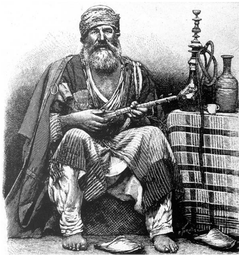
Derwêşekî kurd li Rihayê