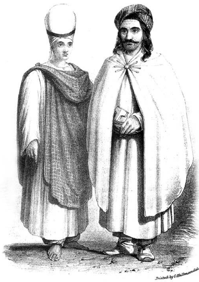
Zilamekî êzdî û jîna wî