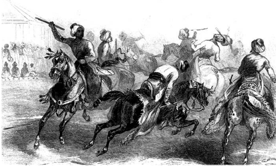
Yarî û cirîdbaziya kurdan