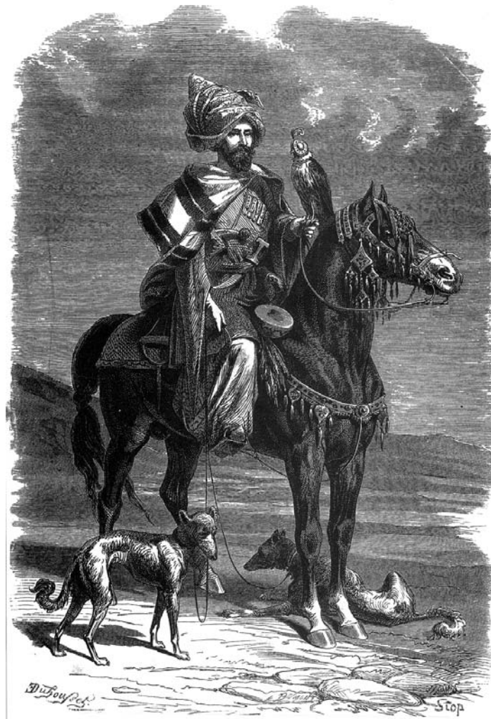
Nêçîrvanekî kurd bi baz, tajî û cewrik