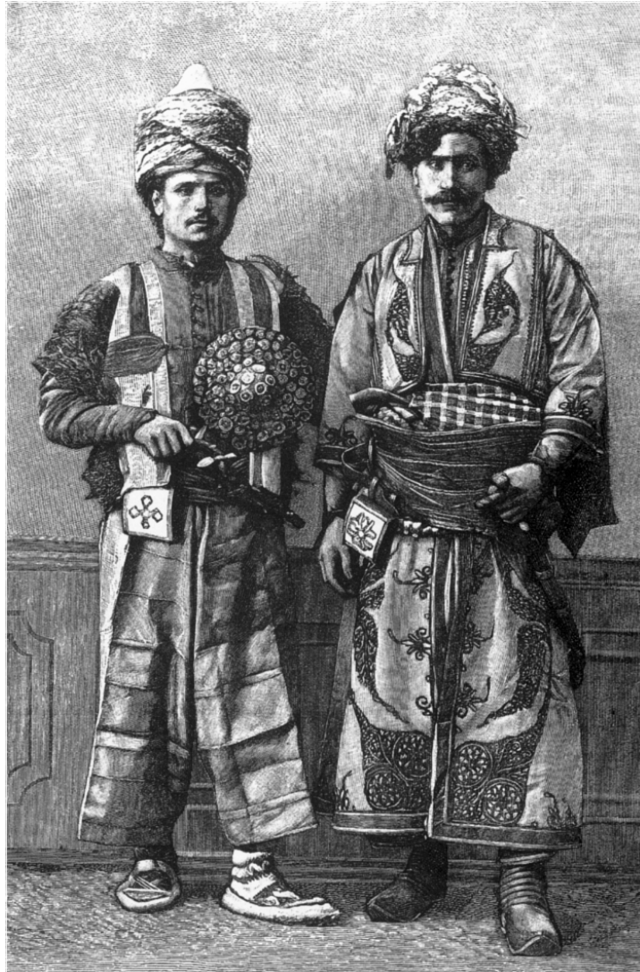
Kurdên navçeya Herzoyê