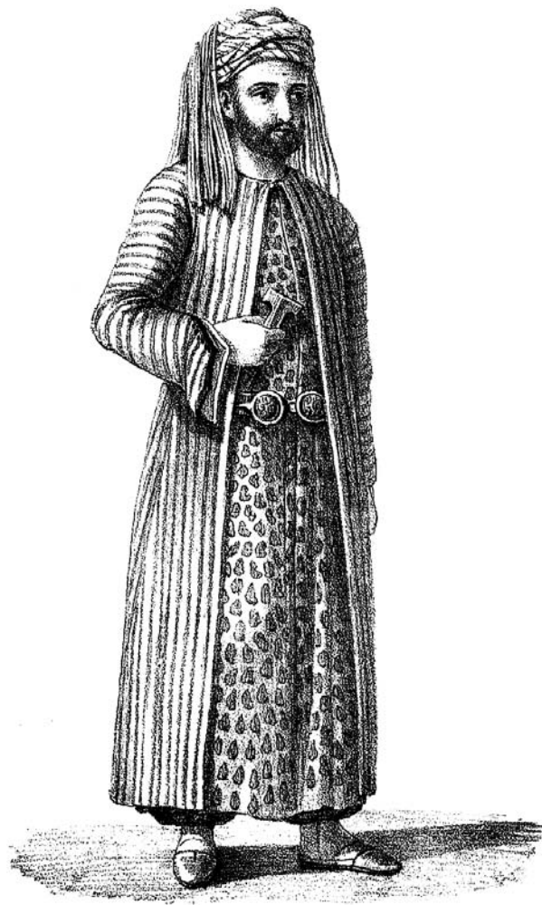
Efserekî kurd di serdema Mîrîşîniya Baban de. Silêmanî