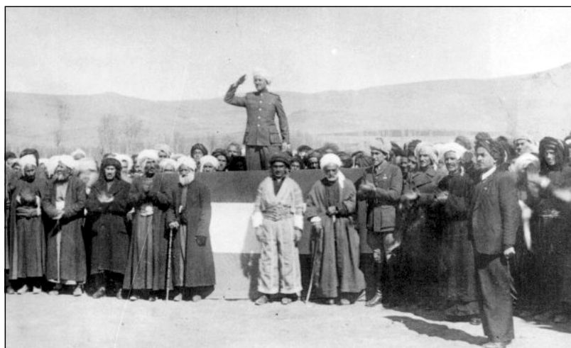
Roja 2yê rêbendanê 22/1/1946 Qazî Mihemed silava leşkerî li pêfîmergên komarê dike

Barzanî di serdema Osmanîyan de jî yek ji hozên herî zêde bi kêşe bûn li hember wan. Di sala 1920 de şêx Ehmedê Barzan, ku barzaniyan û hozên deverê navê "Xudan" li wî kiribûn, bi aşkere rûberûyî birîtaniyan dibû ku çendîn caran jî neçar man daxwaza alîkariya hêzên asmanî yê nî qraliyetê bikin. Dawiyê şêx Ehmed û birayê wî yê biçûk, Mela Mistefa, digel dilxwaz û peyajoyên xwe yê nî sereke hatin nefîkirin; pêşî bo başûrê Îraqê û paşan jî bo Silêmaniyê. 11 Hezîrana sala 1942an, Mela Mis-