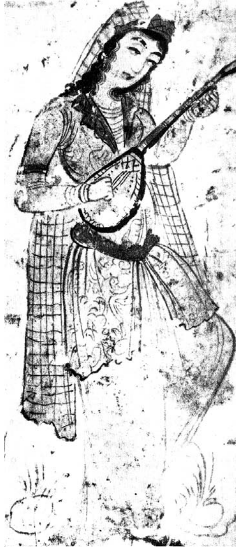
Keçikeka kurd li tembûrê dide