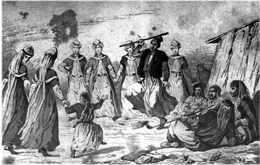
Dilana jinên kurd