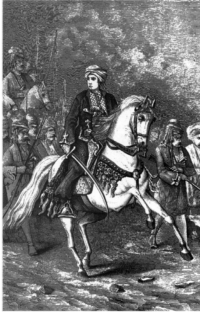
Siwar û şervanên kurd