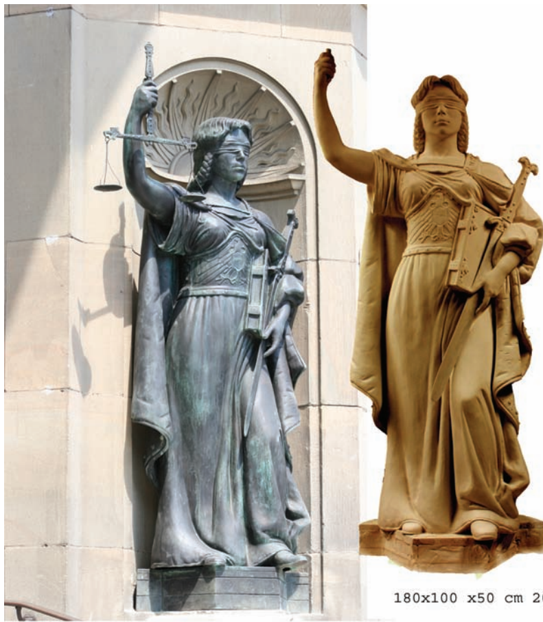
180x100 x50 cm 2009