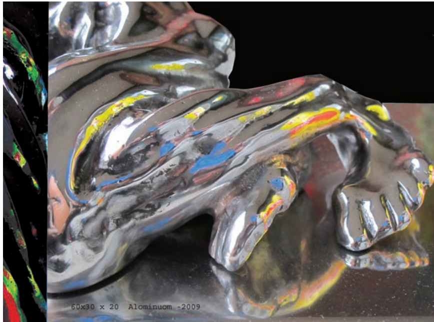
60x30 x 20 Alominuom -2009