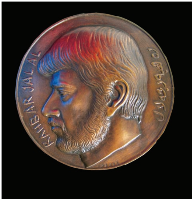
30x20x30cm Bronz 2009 Portrait by Pantar Rahbar Jalal