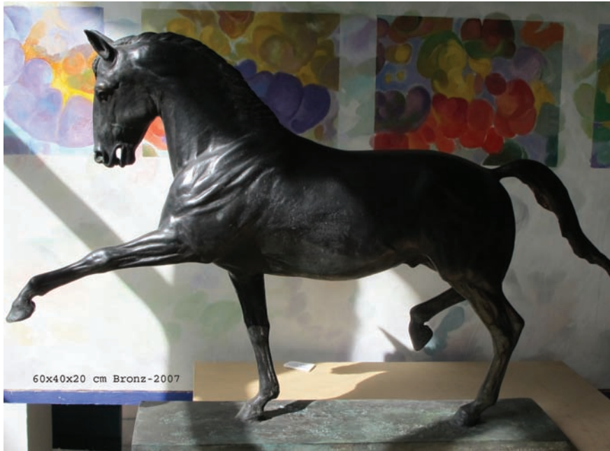
60x40x20 cm Bronz-2007