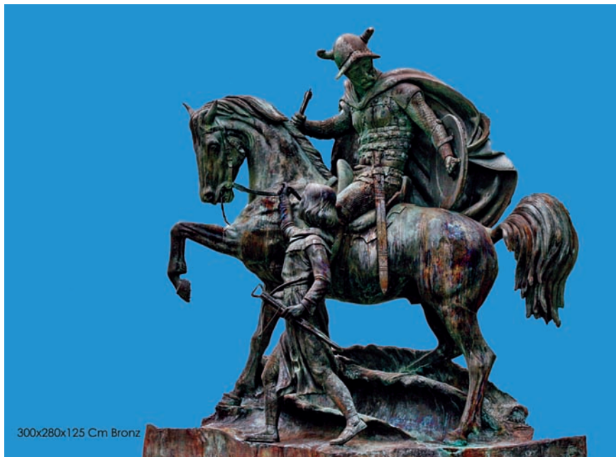
300x280x125 Cm Bronz