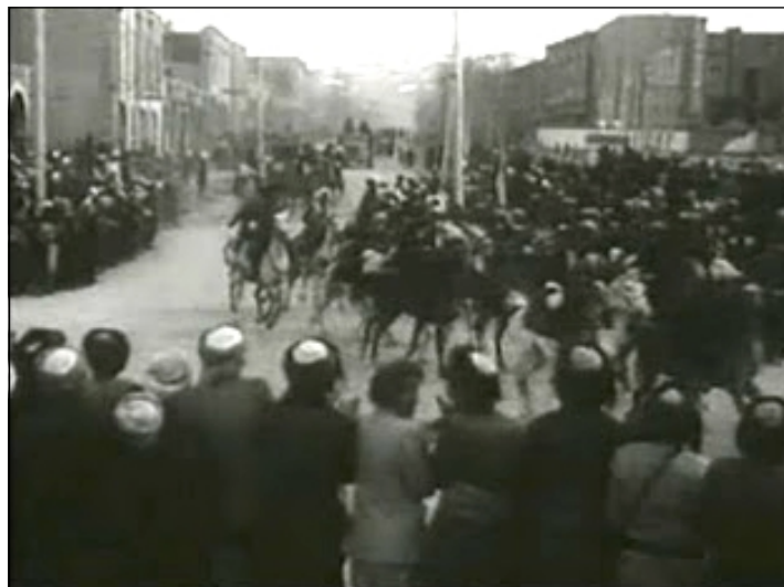
ريوره سمى ديمه نه كى ناف باژيرى مه ابادى ل ده مى كۆماريدا

كوردين روئاقايى نازه ربايجانى /كو مها بادىژى فه دگريت/ پيشبينيا وئ چهندي لى نه ده اته كرن بچنه پال حزبه كى كو بانگه پشستا نه ته وه په روه ريبا توركيابى يا نازه ربايجانى بكت، ژبه ر وئ چهندي پيدفى بوو حزبه كا نوى دروست بكن هياكو به ره هځيان بكت بو چوونا ژير بالى پلانا سوځيه تى، ل ۱۲ى ئه يلوولا هه مان سالا ۱۹۴۵ كاپتن ناماوا ليدف سه ركرده يى سوځيه تى ل باژيرى ميانداو، سه ركرده يين هوزين كوردى دگه ل قازى محمه د و سه يفى محمه دى براى وى بانگه پشست كرن بو ته وريز ب هيجه تا ديتنا كونسولى سوځيه تى، لى دگه ل گه هشتنا وان ئيكسه ر داخواز ژ كوردين حيبه تى هاته كرن به ر هف ويستگه ها ترينى بچن بو باكو، بو ده مى سى روژان ل وئرى د ئاقاهيه كيدا لده رځه ي باژيرى دا مان و ل وئرى چهنده سه يرانه ك بو وان هاتنه ري كخستن