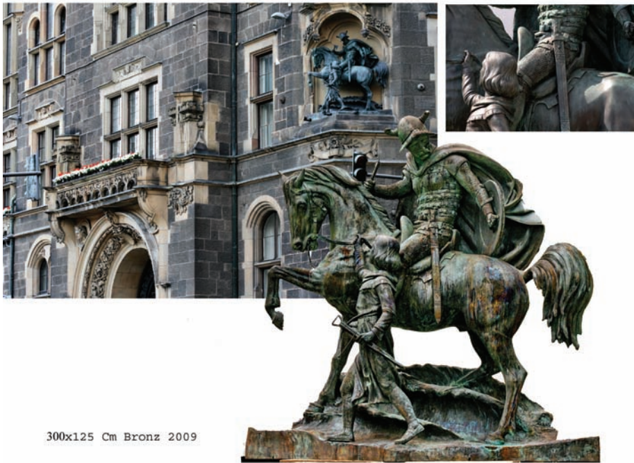
300x125 Cm Bronz 2009