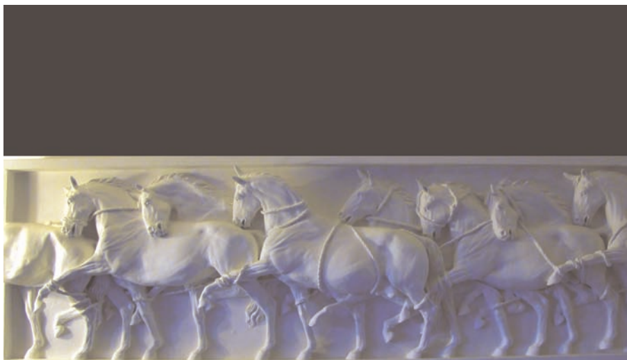
150x50 x10 cm Acristal -2008