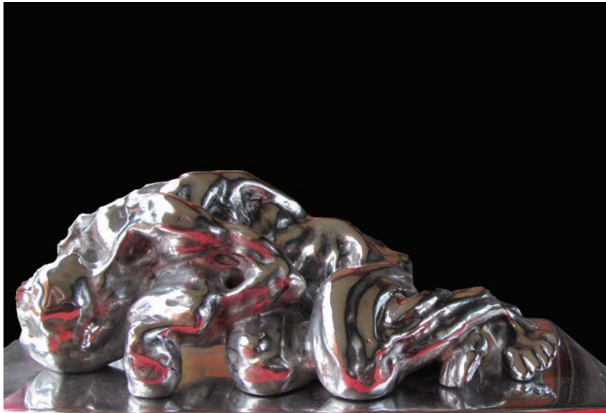
60 X30 X20 Stiel گدرسته ستیل