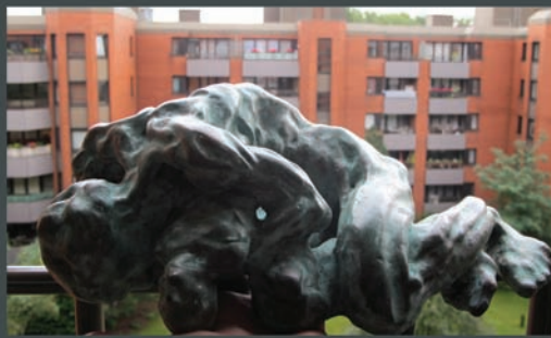
45x20 x20 Cm Bronz - 2008