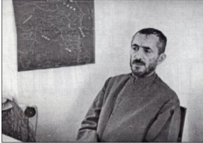
پيشهوا قازى محمەد ل ئۇفيسا خۆ نەخشەيى كوردستانى ب ديواريفه هاتيه هەلاويستن

بىي هيمىن و خودان ميشكهكى بهرفرهه و ميانرهو بوو، د وي دهמידا كو جهي باسكرنييه بلايي كيميجه داخواريين وي بين ميانرهو بوون /ئوتونومي بو كوردان ل سنووري دهولتا ئيرانيدا/ ئەوى باوهرى ب بوچوونا گەلەك كوردان هەبوو كو دگوتن كورد و فارس سەر ب ئيك مالباتا نەژاديا ئيرانينه، ژبەر وي چەندئ هيچ سەدەمەك نينه كو دووباره د ئيك پيکهاتهدا كوم بين وهكو ئەوا لسەردەمى ميديايى و فارسين كهفن، قازى وهها دديت كورد نەقيين ميدييانه، مەيلا وي چەندئ هەبوو بيژيت ناقي مەهاباد ژ ناقي "مالا ميديا" ن هاتييه، هەروها نابيت ئەو چەند بيتە ئينكار كرن كو ئەو بخۆ و لايەنگرين وي خودان حەزەكا كوردانە يا گشتگر بوون هيقييا وان ئەو بوو مەهابادئ بکەنە مەلبەندئ كولتورى يا كوردى و بزافا نەتەوهيى يا كوردى، وهكو جهگرهكى بو سووريا و سلیمانينى كو وي دەمى مەلبەند بوون، گەلەك بزاف دەاتنەكرن بو وي چەندئ فیركرنا كوردى بگههيتە ناستهكى ژ هەژى، لدەستپيكي پيدقى بوو ماموستا د ناف پوليدا ب زارهكى بابەتان ژ فارسي وهگرينه زمانى كوردى، لى بدەمى كورت بەرى هەرفينا كو ماري پەرتوكين كوردى بو قوتابخانيين سەرەتايى هاتبوونە چاپ كرن، هەروها رۆژنامەيهك و هەيقانەنامەيهكا سياسي دەرچوون، هەردووك بناقي كوردستان بوون، هەروها دوو گوشارين ئەدەبى بناقين "هەلاله" و "هاوار" دەرکەفتن كو تەقاييا وان بەلاقوكان ل چاپخانهيهكى دەاتنە دەرخستن كو سوپايى سۆر دابوو حزبا ديموکراتا كوردستانى، دبیت كو گرنگيدانا قازى محمەد بو ئەدەب و زمانى كوردى بو هەبوونا هەردوو هەلبەستقاران هەژار و هيمىن فهگهریت كو سەربارى كيمييا هەبوونا كاغەزان هەلبەستين خۆ بەلاف دكرن.