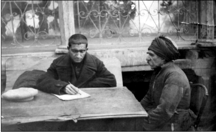
حه جیی جندی ژ حه سوئی مه مق ل گوندی هه کۆدا زارگۆتنی دنقیسه (۱۹۳۱)

سلیمانئ سلیقی، " ۱۷۲ کلامین به نگیتی، ۶۶ نه فراندین زاروتیی، ۴۱ ین گۆقه ندی، ۱۱ کلامین عه قدالی زهینکی، ۳۱ بهیت و سه رهاتی (وهکو) زه مبیلفرۆش"، " خه جی و سیامه ند"، " مه می و عه یشی"، مه م و زین"، " لهیل و مه جلووم"، " ده وریشی نه قدی"، " دم - دم" و یین دن)، ئوسا ژ ۲۵ هکیاتین جمعه تی.