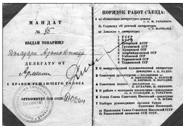
مانداتا حه جيئي جندی

ئەدەبىياتىد گەلئىد ماينرا تەقايى ئوسا ژى دەرھەقا وئ ئەدەبىياتا كوردا تى خەبەردانى كول ئەرمەنىستانى دا دەھاتە سازكرنى. وەكيلەكى وئ ئەدەبىياتى دىلليگاتەكى ھەمجىقنىنى رەوشەنبىر حەجىيى جندى بوو.