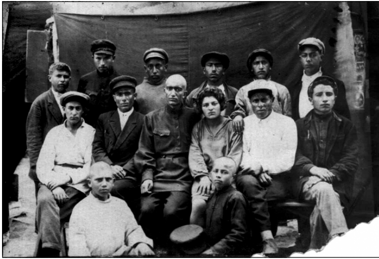
حهجیی جندی (روونشتی، ژ چهپی بی سسیا) تهقی خوهندکاریین (کۆلخۆزقانیان جوان) گوندی ئەلهگهزی (س. ۱۹۳۰)

ئاها وەرگهرا "هوریبا" توومانیان - وەرگهرا ندانا منا پیشن: