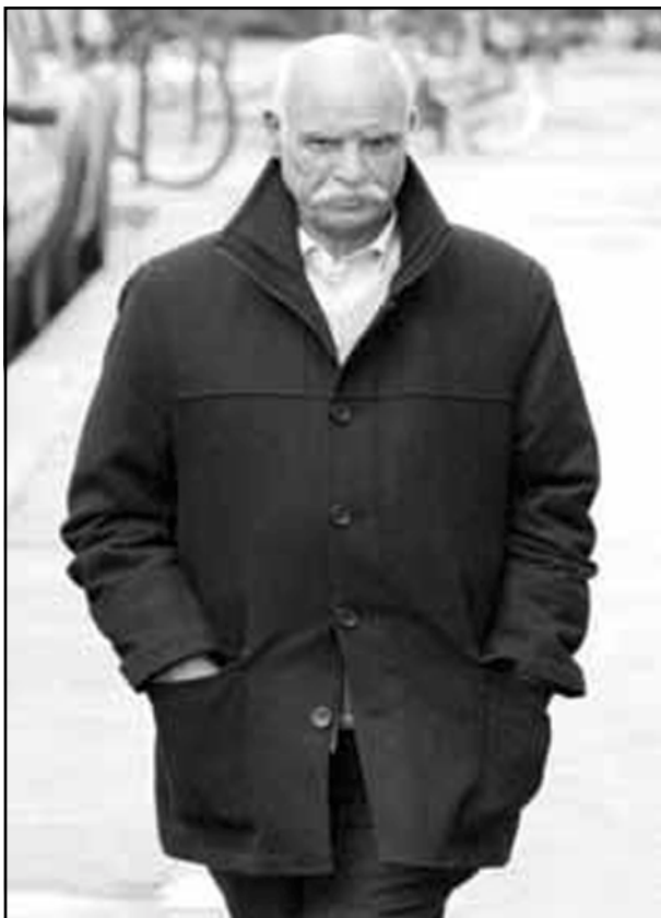
وهستا موبارهکی باوکی رهشیده