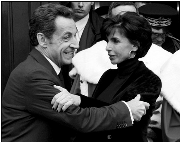
رهشیده و سارکۆزی