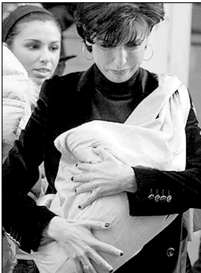
رهشیده زههره‌ی کیژی له باوشدایه