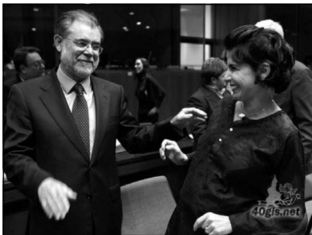
رهشیده له خۆزتی سه روک وهزیرانی ئیسپانیای پیتشوو